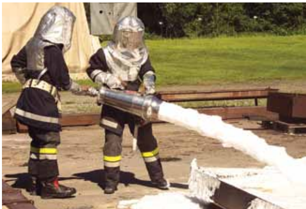
Die Teilnehmer der Grundausbildung beim Flüssigkeitsbrand