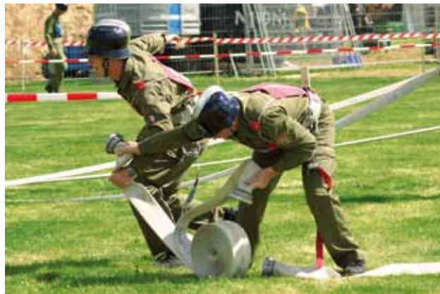
Um jede Sekunde wurde gekämpft.