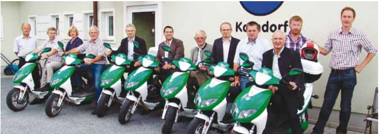
Die Gemeindevertreter sind zur 1. Verhandlungsrunde mit den E-Rollern angereist.

Die sechs Ökoregionsgemeinden erhielten sehr viel Lob für ihre bisherige gute Zusammenarbeit. Auch wurde von den Landesvertretern die gute Bevölkerungsentwicklung und die gute wirtschaftliche Situation der sieben Gemeinden hervorgehoben.