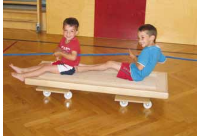
Muki (Mutterkindturnen) 2012

Zwergerturnen für 2-4Jährige (in Begleitung eines Elternteiles) – unter der Leitung