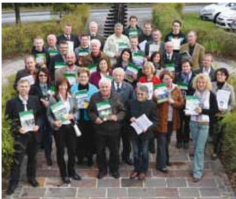
Im Oktober wurde 25 Jahre „Ebersdorfer Nachrichten“ gefeiert.