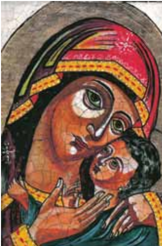
Motiv 1: © Karin Teubl 2010 „Muttergottes mit Kind“

Helfen und Freude schenken in der Vorweihnachtszeit