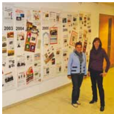
Am 18. Juni fand eine Feier zum Anlass „10 Jahre Gemeindezentrum Ebersdorf“ statt. Viele kulturelle Veranstaltungen fanden 2011 statt.