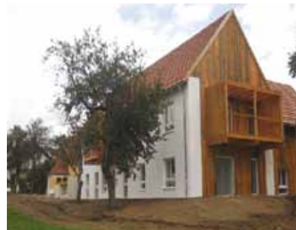
Im November wurden im Bereich des Pfarrhofes Ebersdorf 10 Wohnungen, darunter 6 Einheiten „Betreubares Wohnen“ in Betrieb genommen.