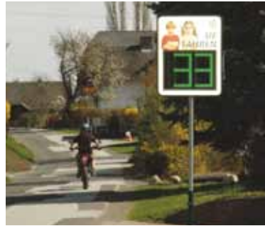
Zur Erhöhung der Verkehrssicherheit auf den Gemeindestraßen wurde ein Geschwindigkeitsmessgerät angekauft