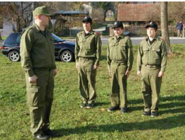
Unsere Teilnehmer beim Wissenstest in Stögersbach