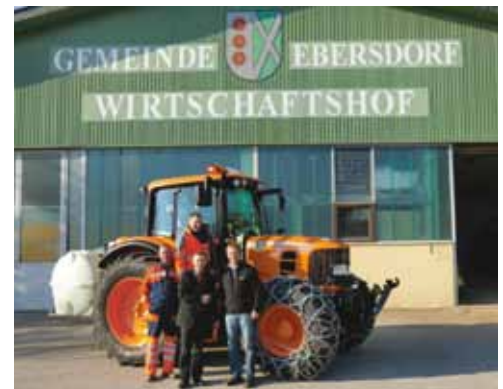
Im Winter 2010/11 wurde ein neues Gemeindefahrzeug gekauft. Der alte Gemeindefahrer war bereits 20 Jahre alt.

Am 20. November fand eine Volksbefragung zum Thema Gemeindefusion statt. Ca. 93 % der WählerInnen waren gegen eine Fusion mit anderen Gemeinden.