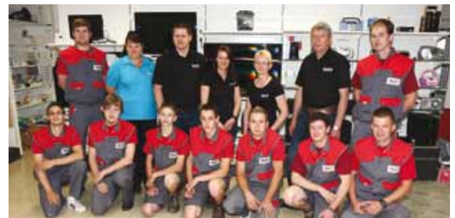
Die Firma Elektro Pörtl eröffnete einen Zubau zum Betriebsgebäude und feierte sein 25jähriges Betriebsjubiläum