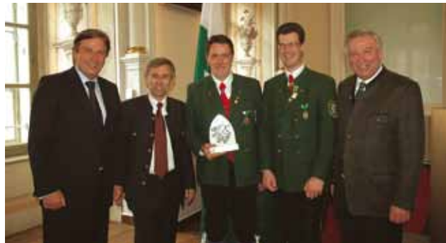
Verleihung des „Steirischen Panther“ an die Trachtenkapelle Ebersdorf