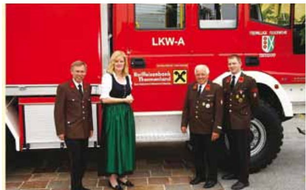
Am Sonntag, den 05. Juni 2011, wurde von der FF-Ebersdorf ein neues Einsatzfahrzeug, ein Lastkraftwagen mit Allradantrieb (LKW-A), offiziell in den Dienst gestellt.