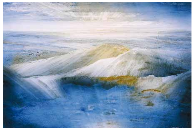
„Archaische Seelenlandschaft“ www.santoni.at