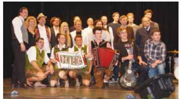
...und viele andere