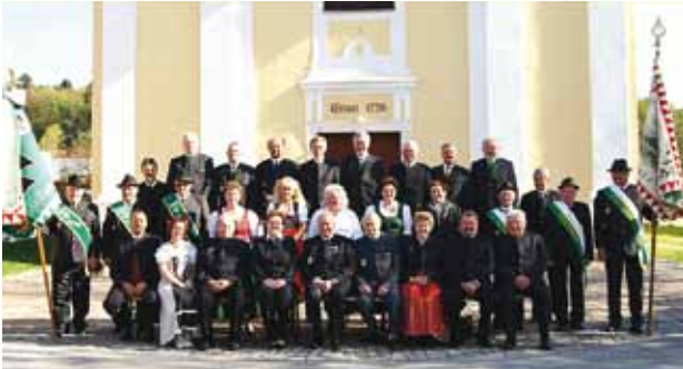
Der ÖKB-Ebersdorf feierte sein 90-jähriges Bestandsjubiläum und veranstaltete am 29. Mai 2011 ein Bezirkstreffen .