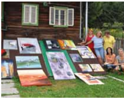
Freies Malen am Rabenwald