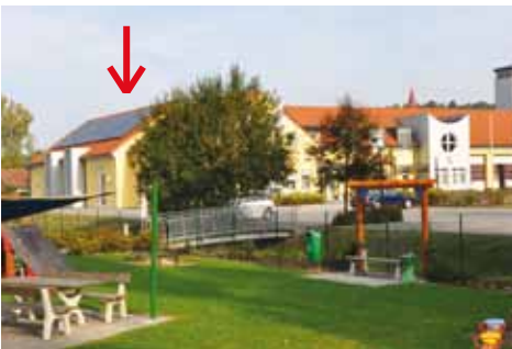
Zwei neue Photovoltaikanlagen wurden im Bereich des Gemeindezentrums Ebersdorf und des alten Gemeindeamtes errichtet.