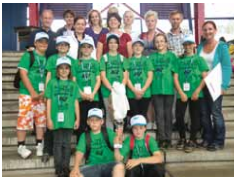
Die Volksschule Ebersdorf wurde Bezirksieger bei der „Safty-Tour 2011“ und errang den 4. Platz beim Landesfinale.