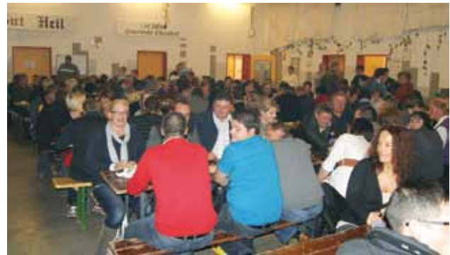
Zahlreicher Besuch bei Sturm und Kastanien

Wir bedanken uns bei allen Besuchern, sowie den freiwilligen Helfern für die Unterstützung und freuen uns auf „Sturm und Kastanien“ im nächsten Jahr!