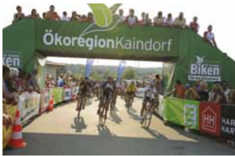
Im Juli fand wiederum das „24-Stunden Biken“ der Ökoregion statt.