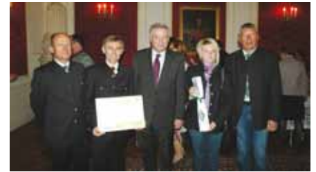
Ebersdorf wurde als „FAIR-TRADE-Gemeinde“ ausgezeichnet