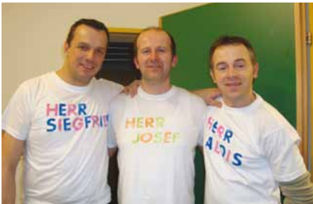
Die fleißigen Gehilfen beim Kinderfasching

Mit den Einnahmen unterstützt der Elternverein verschiedene schulische Veranstaltungen, Ausflüge, Schitage bzw. Ankauf von Schulinventar.