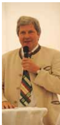
BH Mag. Wiesenhofer