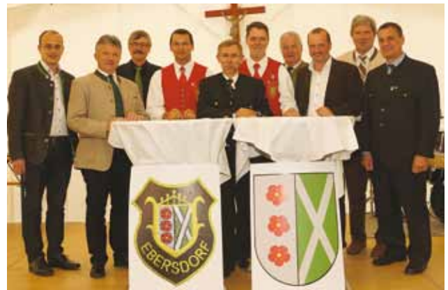
Vetreter der Gemeinde und der Musik mit den Ehrengästen