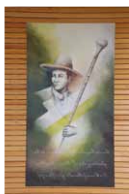
1. Teil des Kunstwerkes