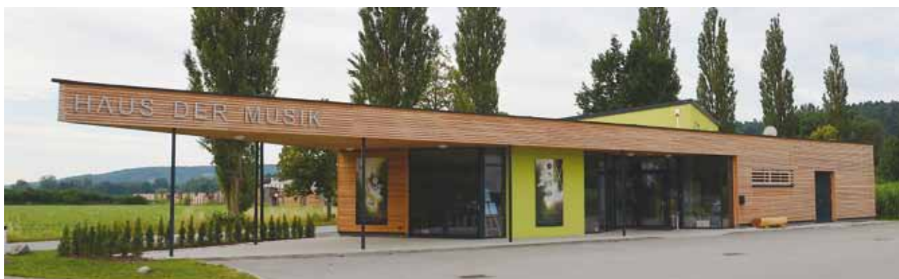
Das neue Musikerheim der Trachtenkapelle Ebersdorf, das „Haus der Musik“