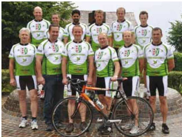
Herrenmannschaft „Gemeinde Ebersdorf“

beim 24-Stunden-Biken für den Klimaschutz 2012 sehr erfolgreich