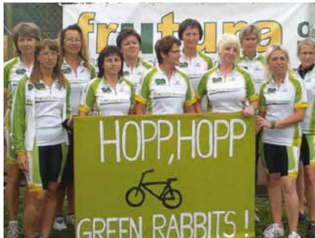
Damenmannschaft „Green Rabbits“

Die Damenmannschaft "Green Rabbits" erreichte den 2. Platz in der Kategorie "Damen 24 Stunden - 12 Teilnehmerinnen". Sie erreichten in 23:33 Stun-