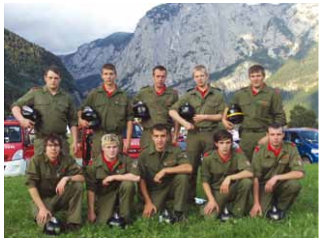
Die erfolgreiche Gruppe beim Bewerb.