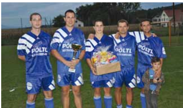
1. Platz: Sportverein Ebersdorf

Am 22. September 2012 fand das diesjährige Gemeindefußballturnier Ebersdorf statt. Sieben Mannschaften nahmen daran teil. Neben fünf Mannschaften aus Ebersdorf spielten diesmal auch 2 Gastmannschaften um den Titel 2012. Heuer gab es ganz besonders spannende Spiele. Der Sieger wurde erst im Elfmeterschießen ermittelt.