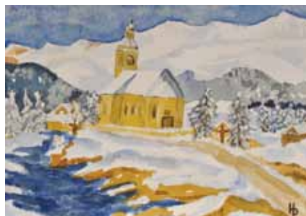
Motiv 2: „Wintertag in den Bergen“ © Hermine Pichler 2011

Bitte unterstützen Sie das Projekt und schenken Sie Freude durch ORIGINAL-Kunstwerke und weihnachtliche Grüße!