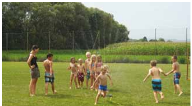
Spiel, Sport, Spaß