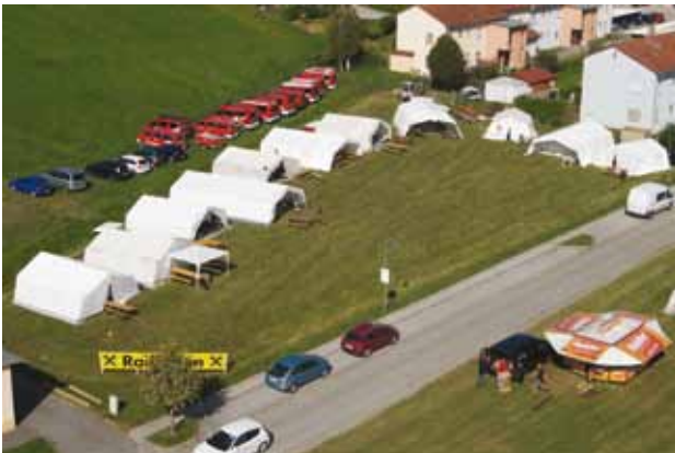
Jugendlager in Rohrbach a. d. Lafnitz